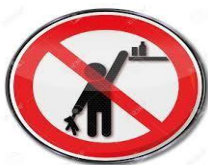
MANTENGA FUERA DEL ALCANCE DE LOS NIÑOS